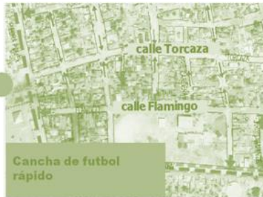
Cancha de futbol rapido