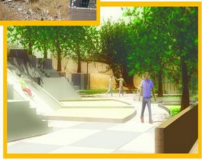
VISTA DE MEDIA CANCHA