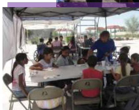
Niños de la comunidad en la decoración de sus mascararas. Octubre 2010.